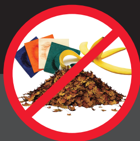
不得投入 可堆肥材料