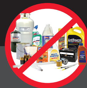
不得投入有害废物 StopWaste.org/HHW