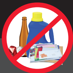
不得投入 可回收材料

联合城市市政法典第7.24条要求将材料分类后投入相应的容器中。 容器盖子必须能够完全关闭。切勿投放超过容器容量的废物。