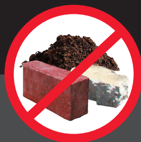
不得投入 砖头、土或混凝土